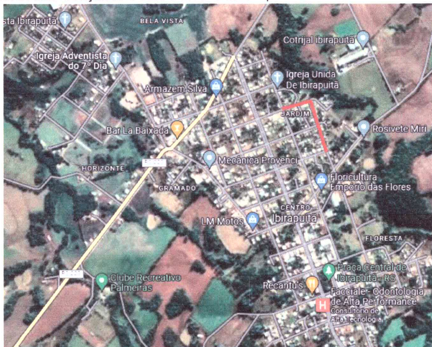
Imagem 1: Ruas Bentos Gonçalves e Júlio Becker a serem pavimentadas

A obra contempla a execução de pavimentação com piso intertravado de concreto nas Ruas Bento Gonçalves, trecho entre as Quadras (147-148 – 159 A-160); e Júlio Becker, trecho entre as Quadras (146-147). Nas Imagens 1 e 2 verifica-se a localização dos trechos a serem pavimentados.